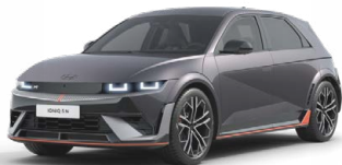
Ecotronic Gray Perleťová Cena: 19 900 Kč