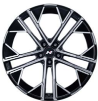
21" kovaná kola z lehké slitiny

Všechny ceny se rozumějí v Kč včetně DPH, není-li uvedeno jinak. Dovozce si vyhrazuje právo změny cen a provedení bez předchozího upozornění. Pro konkrétní nabídku se prosím vždy obraťte na nejbližšího prodejce Hyundai. Veškeré ceny, údaje a vyobrazení jsou pouze informativní, doporučené společností Hyundai Motor Czech s.r.o. a nezavazují k uzavření smlouvy. Fotografie jsou pouze ilustrativní.