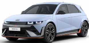
Performance Blue Matná metalická Cena: 24 900 Kč