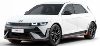
Atlas White Matná metalická Cena: 24 900 Kč