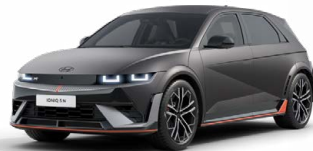
Ecotronic Gray Matná metalická Cena: 24 900 Kč