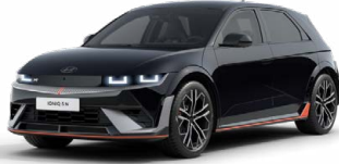
Abbys Black Pearl Perleťová Cena: 19 900 Kč