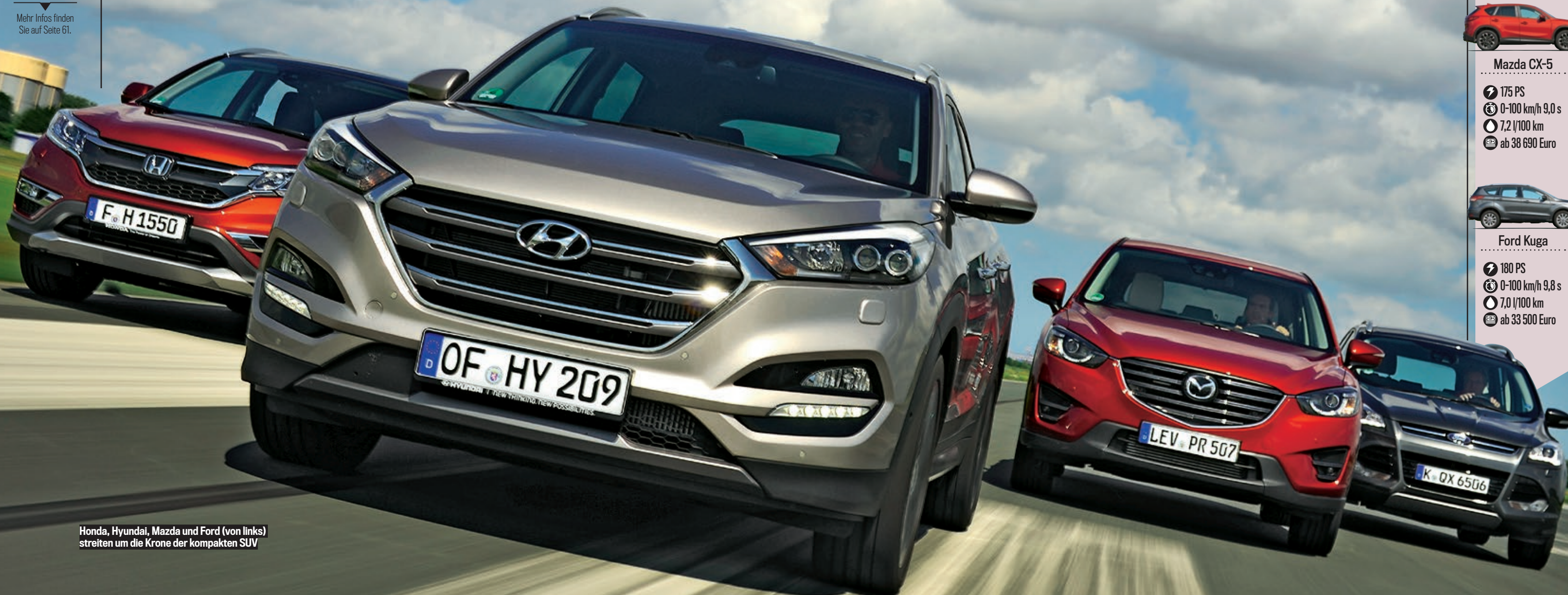
Honda, Hyundai, Mazda und Ford (von links) streiten um die Krone der kompakten SUV